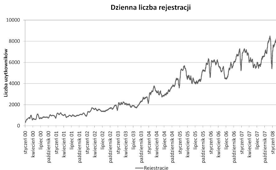
Rys 3. Dzienna liczba rejestracji w latach 2000-2007

Rysunek 3 przedstawia dynamikę przyrostu użytkowników serwisu Allegro wraz z jego zagranicznymi oddziałami w Bułgarii, Czechach, Rosji, Rumunii, Słowacji, Ukrainie i na Węgrzech. Zaobserwowano stałą tendencję wzrostową, osiągającą od początku 2008 roku średni przyrost 7921 użytkowników dziennie. Co ciekawe, na wykresie widać, że liczba nowo rejestrowanych użytkowników posiada minima lokalne pod koniec grudnia oraz przez cały lipiec każdego roku. Pobrano informacje o 10 054 530 kontaktach użytkowników. 12% wszystkich kont jest zawieszonych, natomiast 26% kont nigdy nie było używanych.