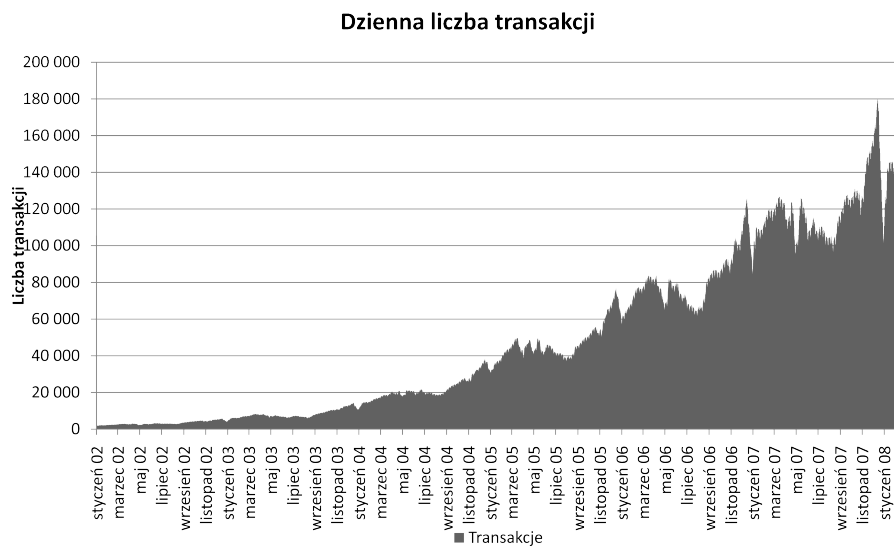
Rys 1. Dzienna liczba transakcji w latach 2002-2007

Rysunek 1 ilustruje liczbę transakcji zakończonych wystawieniem komentarza, na rysunku nie ma transakcji z lat 2000-2001, których jest znikoma liczba. Wraz z upływem czasu widać wzrost liczby realizowanych transakcji. Dynamika wzrostu utrzymuje się na średnim poziomie 109% rocznie, przy czym w ostatnim roku było to tylko 49%. Wyniki pokazują rosnące znaczenie zawieranych transakcji C2C. Grudzień i marzec każdego roku cechują się silnym skokiem w górę, co związane jest ze wzmożonymi zakupami świątecznymi.