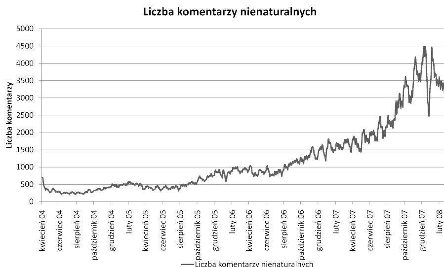
Rys 2. Liczba transakcji, do których komentarz jest opóźniony co najmniej o 6 miesięcy

Rysunek 3 przedstawia dynamikę przyrostu użytkowników serwisu Allegro wraz z jego zagranicznymi oddziałami w Bułgarii, Czechach, Rosji, Rumunii, Słowacji, Ukrainie i na Węgrzech. Zaobserwowano stałą tendencję wzrostową, osiągającą od początku 2008 roku średni przyrost 7921 użytkowników dziennie. Co ciekawe, na wykresie widać, że liczba nowo rejestrowanych użytkowników posiada minima lokalne pod koniec grudnia oraz przez cały lipiec każdego roku. Pobrano informacje o 10 054 530 kontaktach użytkowników. 12% wszystkich kont jest zawieszonych, natomiast 26% kont nigdy nie było używanych.